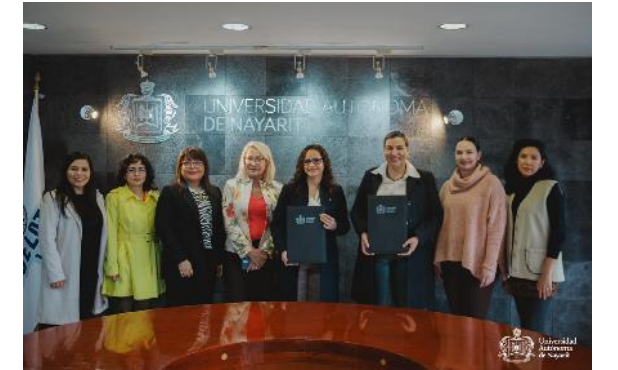
Firma de convenio de colaboración UAN-IEEN

en la violencia política en razón de género, posicionando a la UAN, entre las pocas universidades a nivel nacional que llevan a cabo el proceso.