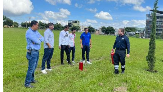
Capacitación al personal de vigilancia en el uso de extintores

Durante el año 2023 se completó el 98% de la instalación de cámaras en el campus, cubriendo espacios de acceso y zonas de riesgo y el 100% de la adecuación del espacio del centro de control y monitoreo. Así mismo, se incluyó el capítulo titulado: Del uso de sistemas tecnológicos, centros de control y accesos automáticos para prevención y monitoreo de seguridad, en el Reglamento de Seguridad de la Universidad Autónoma de Nayarit.