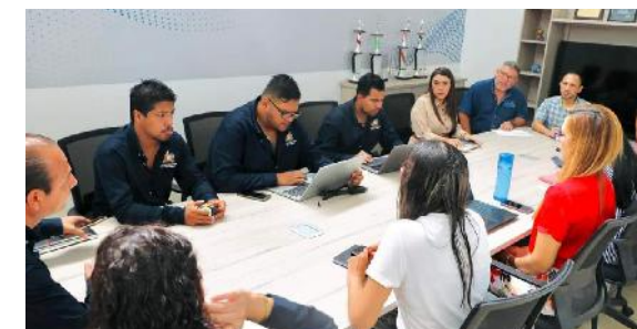
Seguimiento al proceso de actualización de inventarios de la universidad

Para más información, te invito a visitar nuestro sitio web https://bit.ly/3RgVvBB