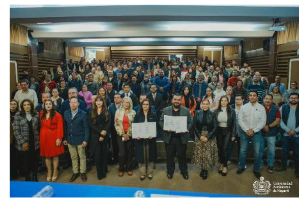
Firma del Convenio UAN y Sistema Local Anticorrupción de Nayarit

Por lo anterior, se llevaron a cabo diferentes convenios de colaboración, entre los que destacan: el convenio general de colaboración celebrado con el Instituto Nacional de Ciencias Agrícolas de la República de Cuba, el acuerdo de cooperación celebrado con la Universidad Católica de la Santísima Concepción de la República de Chile, el convenio general de colaboración celebrado con el Comité Coordinador del Sistema Local Anticorrupción del Estado de Nayarit y el convenio de colaboración en materia de proceso de consulta previa a personas con discapacidad del Estado de Nayarit.