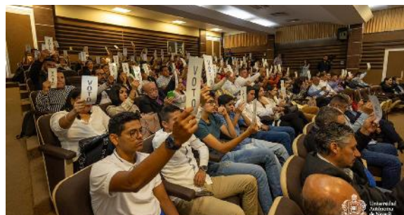
Sesión del Consejo General Universitario

Mediante estas sesiones se han aprobado 45 acuerdos que orientan el quehacer institucional hacia el cumplimiento de metas académicas y administrativas, plasmadas desde la normatividad universitaria. Entre los objetivos específicos de dichos acuerdos, se encuentran el establecimiento de comisiones permanentes y especiales con un fin en particular, modificación o creación de planes y programas académicos que la institución ofrece, actualización de normativa como reglamentos, lineamientos y manuales.