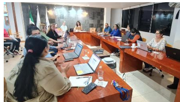
Reunión de trabajo Programa Operativo Anual

Para lograr este seguimiento, se fortaleció el proceso de evaluación trimestral, en donde las dependencias académicas y administrativas emiten una autoevaluación atendiendo el cumplimiento de metas y acciones, así como su nivel de desempeño. Posterior a ello, se hace una retroalimentación sobre aquellos resultados pendientes, que es entregada a los directivos correspondientes, con el propósito de establecer un plan de trabajo que permita lograr los objetivos. Este seguimiento y retroalimentación, fueron la pauta para lograr un incremento en el nivel de desempeño institucional, cerrando el año 2023 con un 83%. Esto representa que en general, se tuvo un cumplimiento alto en las metas y acciones comprometidas al inicio del año evaluado, esto como resultado del seguimiento y de la intervención oportuna de los responsables de cada POA.