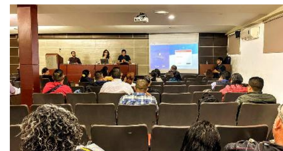
Capacitación Módulo de Servicio Social a enlaces de Unidades Académicas de Nivel Superior

En cuanto a la plataforma PiiDA, se actualizó el Módulo de Servicio Social atendiendo a la reestructuración organizacional que se dio dentro de la Institución. En esta, se trabajó en mantener la interoperabilidad con el Sistema de Administración Documental y de Control Escolar SADCE y el Sistema Automatizado de Administración y Contabilidad Gubernamental, además de la revisión de los flujos de solicitud y liberación del trámite para no requerir la presencia del alumno físicamente en instalaciones de la UAN, es decir, todo el proceso de solicitud, acreditación, bajas y liberación, se realiza completamente en línea. Lo anterior es un logro que permite que la Institución pueda contar con procesos digitales y resguardados en la nube.