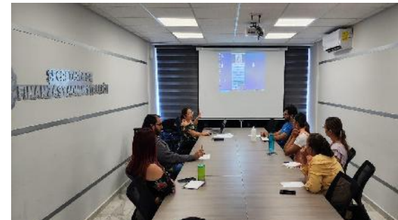
Capacitación en el uso y manejo del sistema de Ingresos de Caja Central

Aunado a lo anterior, se llevó a cabo una capacitación en las dependencias académicas y administrativas en el uso y manejo del Sistema de Ingresos de Caja Central. A la fecha se cuenta con un avance del 85% en la implementación de la prepóliza de ingresos que permitirá empatar este sistema con el Sistema Automatizado de Administración y Contabilidad Gubernamental, logrando efficientar el registro contable con oportunidad.