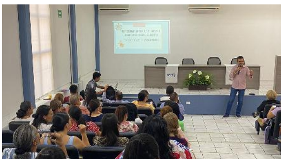
Jornadas de capacitación en gestión documental y administración de archivos

Con el fin de facilitar la organización control y ubicación de los documentos institucionales, se aprueba el Cuadro General de Clasificación Archivística, que es un instrumento de control