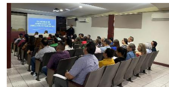
Reunión con directores y funcionarios de la universidad para dar seguimiento al proceso de actualización de inventario

Para llevar este proceso de actualización, se revisaron un total de 7 Unidades Académicas del Nivel Superior, 1 de Nivel Medio Superior y 12 dependencias administrativas. Como resultado se registraron un total de 30,116 bienes en el Sistema de Administración de Inventario, de los cuales 18,808 fueron ubicados y 10,608 cuentan con su resguardo actualizado.