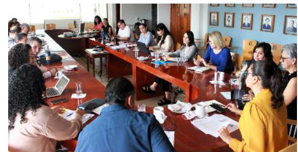
Reunión de Comité de Planeación Institucional

Por lo anterior, la comunidad universitaria ha contribuido desde cada uno de sus espacios, mediante la actualización de procesos, reorganización de estructura, creación de lineamientos, normas, políticas o reglamentos, así como, desde el fortalecimiento del Sistema de Planeación Universitaria, que han permitido avanzar en cada uno de los logros y avances que se han descrito a través de los 4 ejes anteriores. Es decir, desde el eje de Gestión Responsable y Buen Gobierno, se da el marco de referencia, que orienta y da sustento a las acciones que se desarrollan a lo largo y ancho de la Universidad.