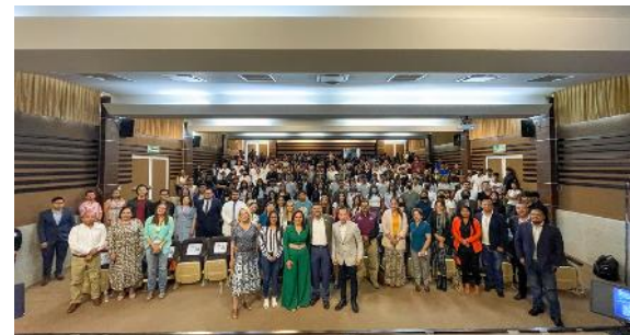
Semanas Universitarias por la Transparencia

del Estado de Nayarit ITAI, así como por la Universidad Autónoma de Nayarit.